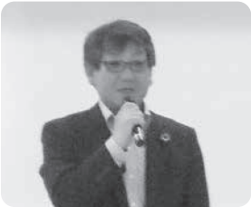
野崎県本部推進委員長