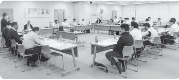
県本部推進委員会の様子

協働組織としての「ろうきん」の特徴は、会員(労働組合・互助会等)が主体的に「ろうきん」の事業運営に参画することにあります。本委員会は、そのための組織であり、会員相互の協働と連携を強め、日常的に職場と地域の中で「ろうきん」運動を推進し、労働者福祉運動の発展に寄与することを目的に開催されています。