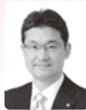
宮崎県知事 河野 俊嗣