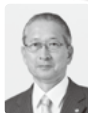
労働者福祉中央協議会 会長 神津 里季生