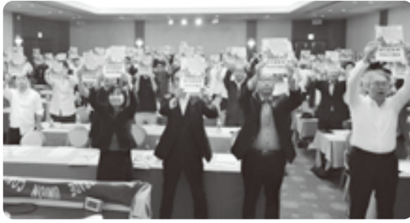
核兵器廃絶1000万署名!